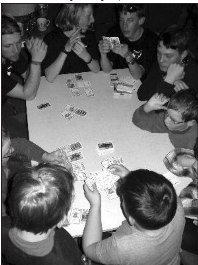
BANG! ve vytopené společenské místnosti Smrčiny