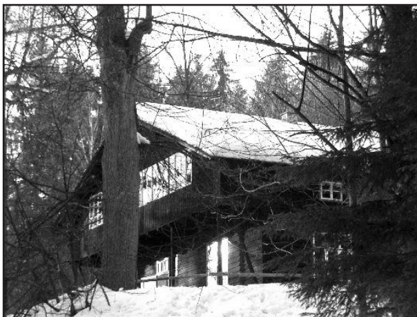
Pohled na chatu Smrčina na lesnatém kopci