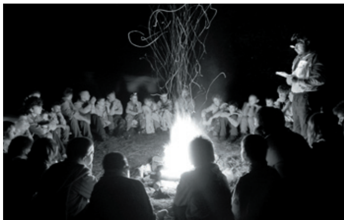
Závěrečný táborový oheň tábora Nadace 2006 na Lásenici.