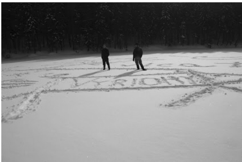
I umělecký duch se ve skautu rozvíjí.