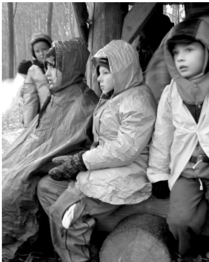
Děšť na prosincové výpravě na Byčí skálu